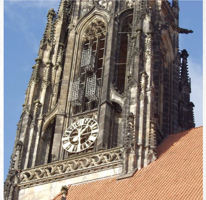
Las jaulas donde todavía se exhibieron los cuerpos de tres de los primeros anabaptistas en 1536 después de ser torturados y asesinados aún cuelgan de la iglesia de San Lambert en Münster, Alemania.

Desde sus inicios, el menonitismo fue considerado una tercera ola de fe cristiana. Sus predicadores eran intrépidos y francos. Sus adherentes eran apasionadamente devotos y mostraban una fidelidad "incluso hasta la muerte". La persecución parecía infundir un mayor compromiso en las mentes y corazones de los fieles.