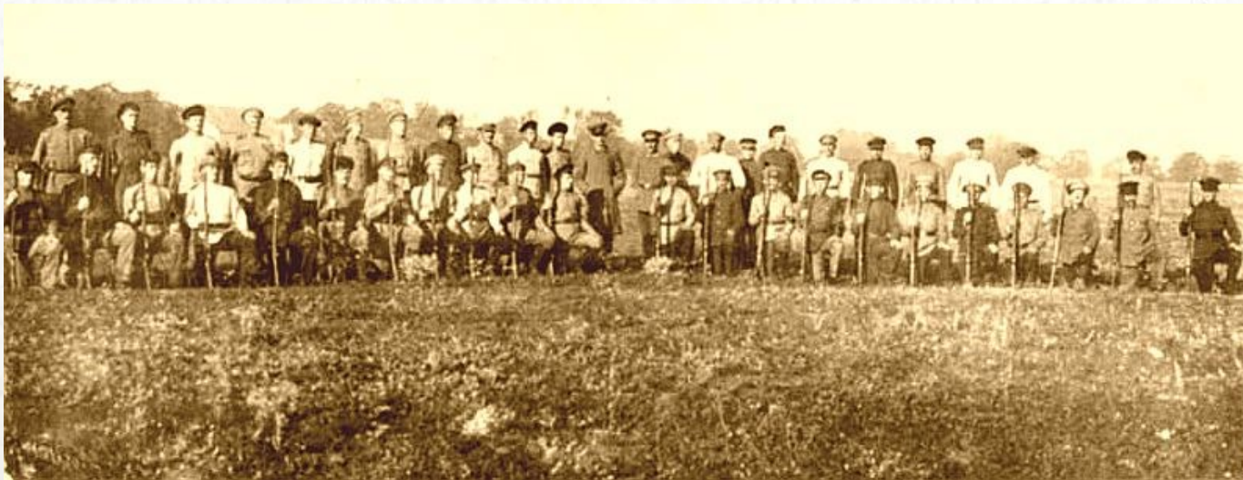
Eine mennonitische Selbstverteidigungsmiliz in der Ukraine

Los menonitas han debatido recientemente entre ellos sobre su historia en Ucrania, donde algunos menonitas ayudaron en la persecución de los judíos y otros. Esto es una fuente de vergüenza que algunos preferirían ignorar o negar.