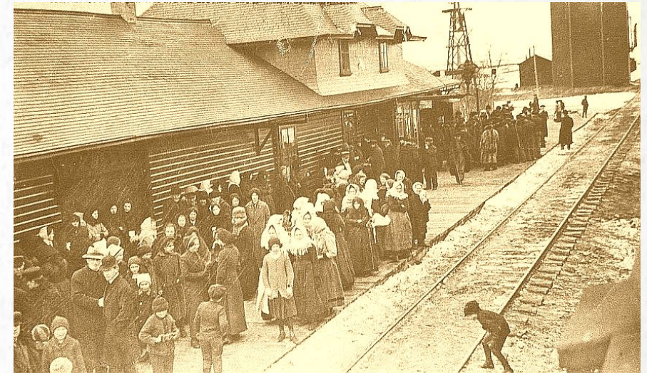
Menonitas esperando el tren para Chihuahua en Manitoba, Canadá

Los menonitas llegaron a Chihuahua e se enfrentaron a los celos y el resentimiento.