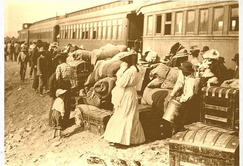
Mormones saliendo de México desde Pearson

Los que se quedaron o regresaron, prosperaron y son famosos por su producción de frutas y ganado.