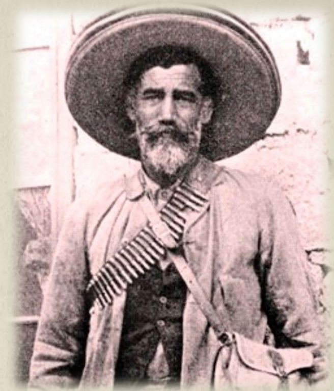
General Maximo Castillo

LAS CUATRO CULTURAS: MESTIZO, MENONITA, CHINO Y MORMÓN