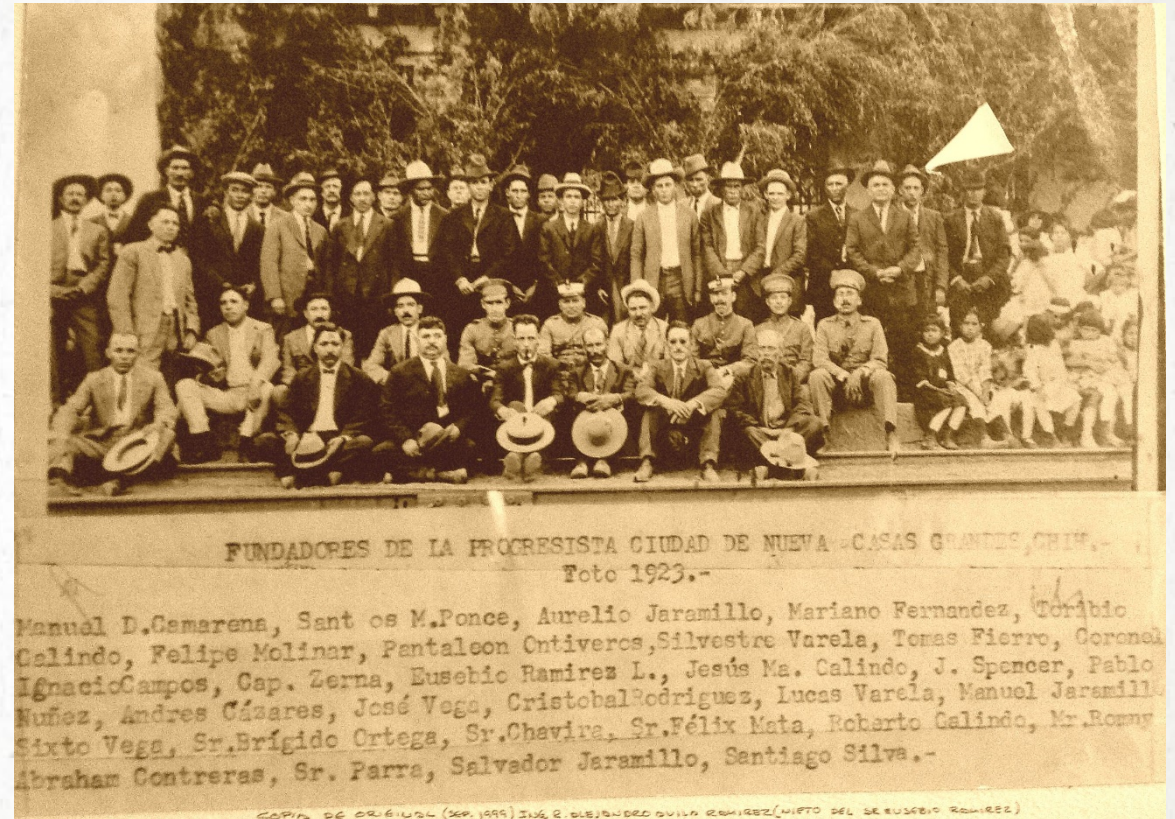
Mestizos y Mormones – Fundadores de NCG 1923

Los menonitas llegaron después de la revolución y se les dio la responsabilidad de reconstruir el área en medio de un resentimiento significativo