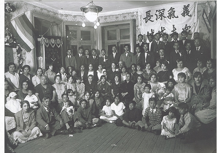
Logia Masónico Chino en Chihuahua en 1911

El noventa y ocho por ciento de los inmigrantes chinos eran hombres que se casaron con mujeres mexicanas