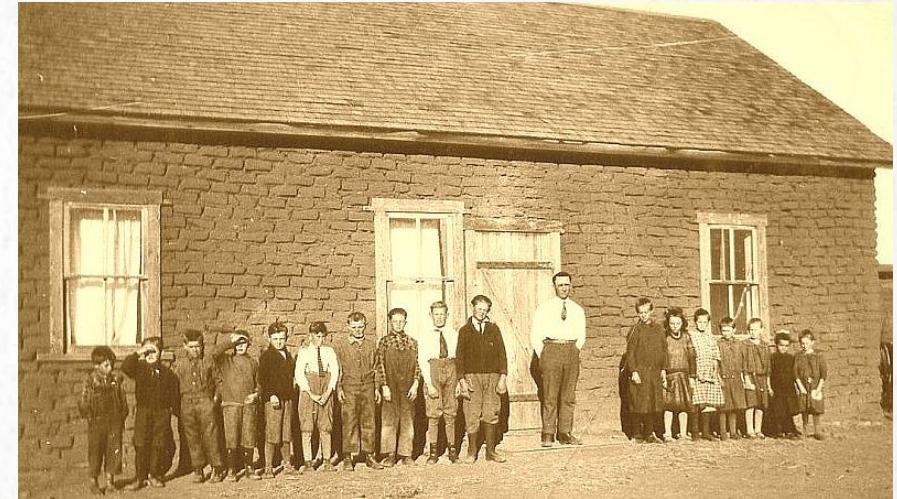
Escuela Menonita en Chihuahua

Sin embargo, prosperaron y han crecido a más de 150,000 menonitas en Chihuahua. Son famosos por sus quesos y productos agrícolas.