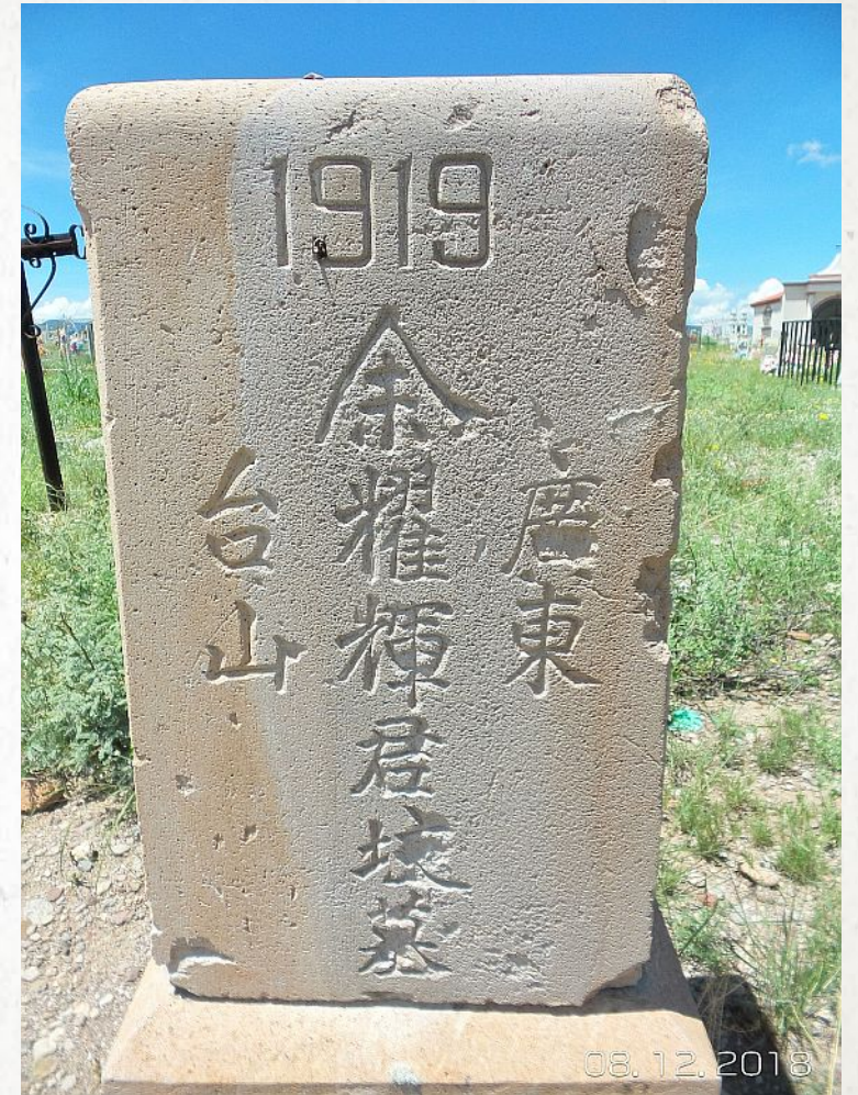
Lápida china en el panteón de Pearson

En la década de 1930, el prejuicio anti chino alcanzó su punto máximo. La mayoría salieron de México.