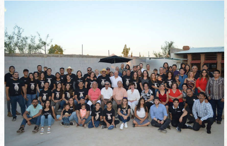
Un Encuentro de Mestizos - La reunión familiar de los descendientes del General Máximo Castillo (que se muestra en la portada)

Durante la revolución hubo batallas entre mestizos en Janos, Nuevo Casas Grandes, Casas Grandes y Pearson. Orozquistas, villistas, castillistas, vazquistas, magonistas, huertistas y varios ejércitos federales lucharon en y alrededor de Nuevo Casas Grandes.